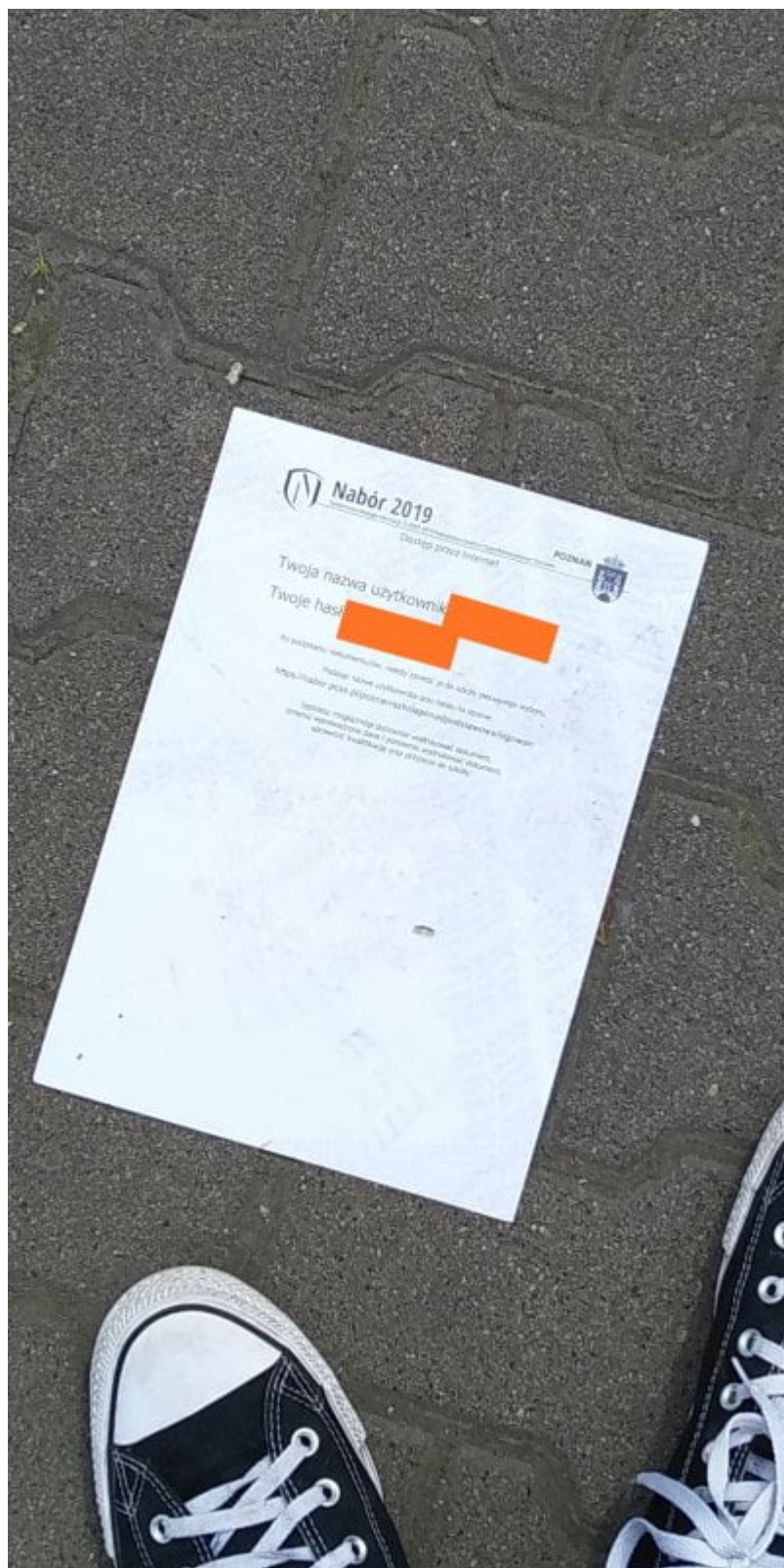
Zdjęcie zostało zrobione koło godziny